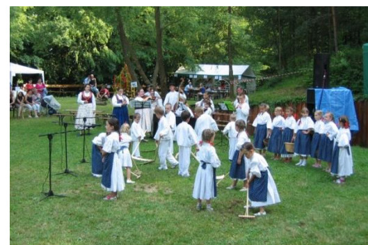
Mladší Dokopyjánek na Svat. slavnostách 22.6.2013