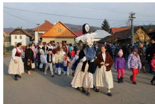
Vynášení Moreny ve Vrběticích 17.3.2013