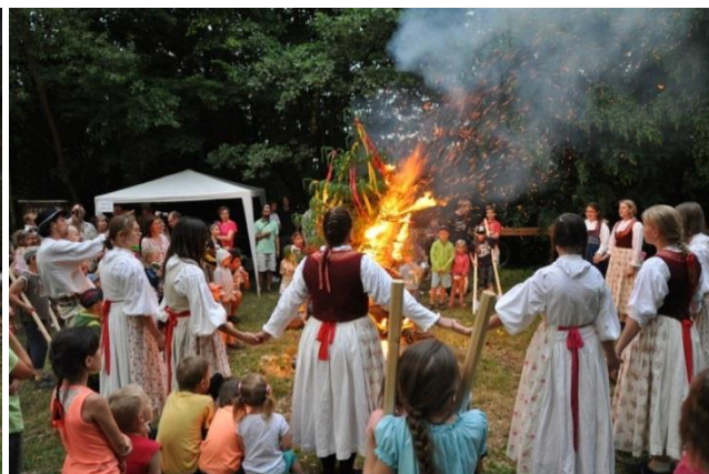
Slavnostní zapalování svatojánského ohňa

Předhodový kulturní večer – byl uspořádán v pátek večer 27. září v KD Vlachovice, místo letních Kulturních večerů na Hradištku. Kromě toho jsme ale hlavně chtěli napomocť, aby naše Vlachovské hody byly víc kulturnější a slavnostnější. Na začátku a na konci večera byly promítnuté všelijaké staré filmové záběry z Vlachovic a Valašských Klobouk. Hlavním programem ale bylo to, že jsme do Vlachovic pozvali velice inspirativní mladé lidi z obce Strání, kteří k nám jednak přivezli jejich známý folklórní sůbor Javorina, v kterém sami účinkují, ale jedna z jejich najzajímavějších aktivit je jejich inovátorské zfilmování jedné z mnoha lidových Straňanských balad – Chodíval Matúšek. Podílali sa na tom s chuťou dokopy enem občané a spolky ze Strání a o kvalitě tohoto amatérského snímku svědčí nekolik obdržených filmových cen. Ve Vlachovicích byl snímek promítnut a proběhl aj rozhovor s hlavními tvůrci filmu.