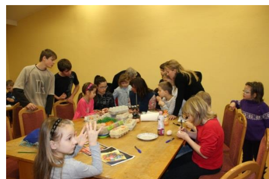
Velikonoční tvořivé odpoledňa aneb kdo udělá pěknější vajco :-)