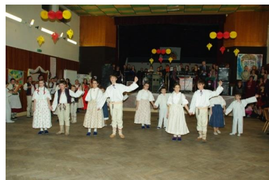
Vystoupení na Rodičovském plese 18.1.2013