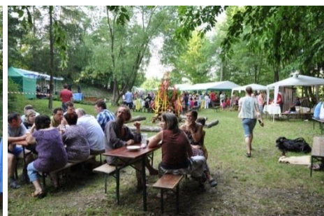
Byli jste tam takéj?