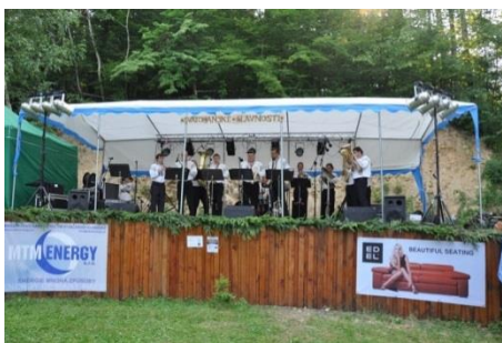
Dechová kapela Záhorovjané