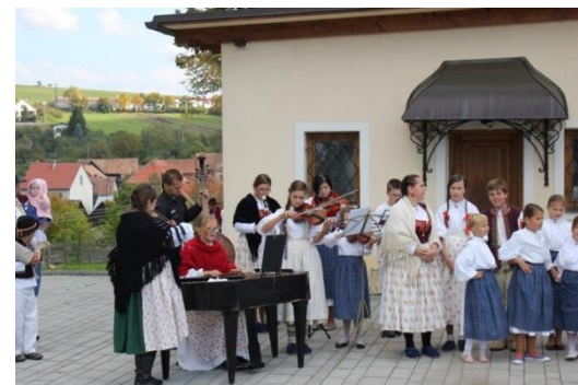
Vlachovská cimbálová muzika Dokopyjan při vlachovských hodách 29.9.2013